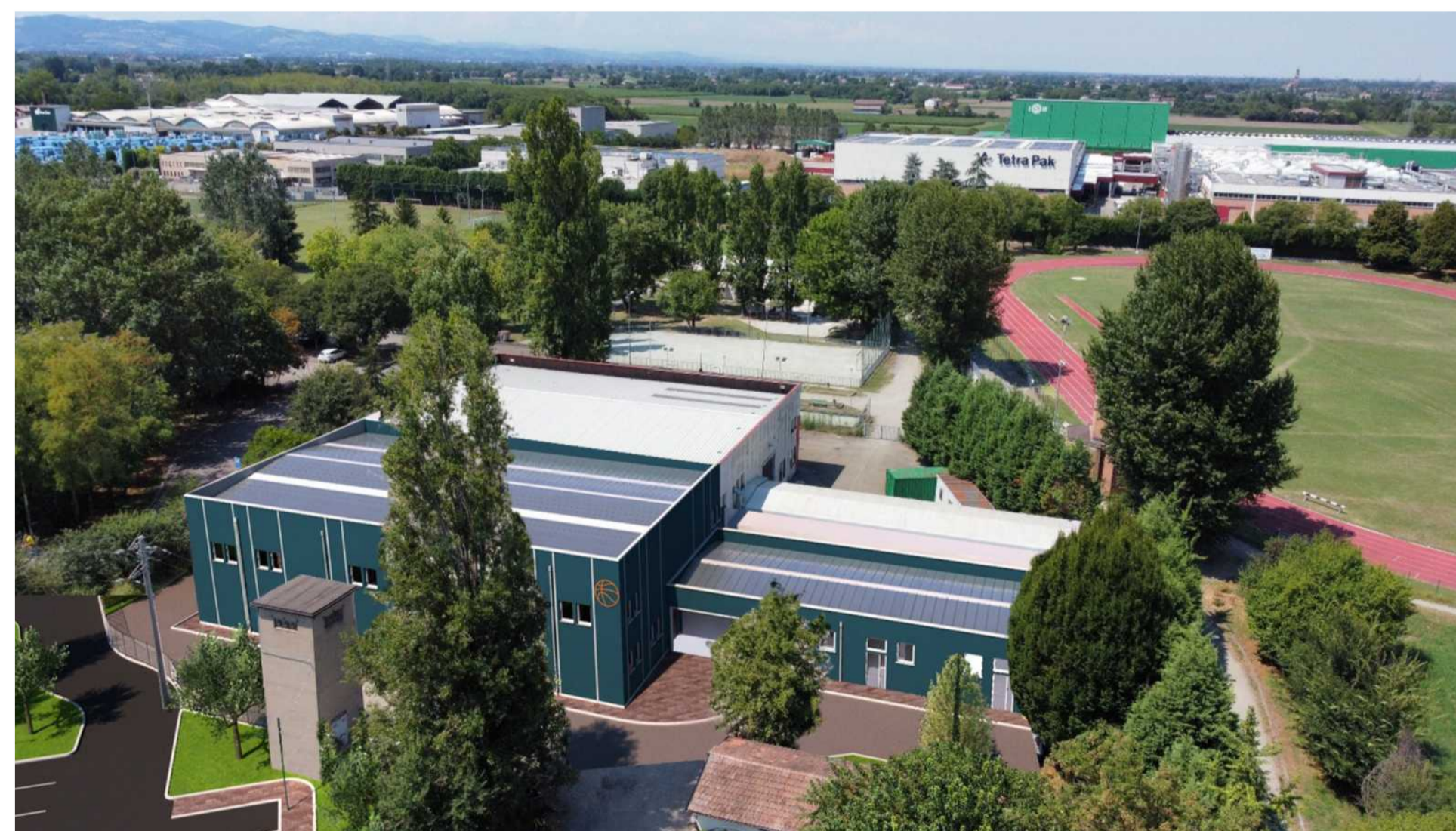
PROPOSTA TINTEGGIO B